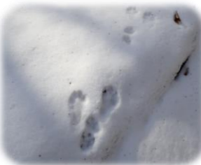
トウホク ノウサギの足跡