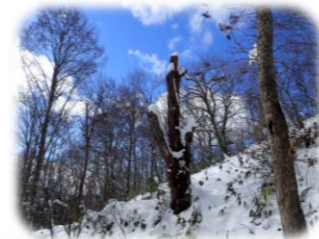
マザーツリー (ブナの枯れ木)