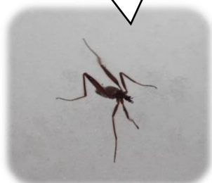
クモガタ ガガンボ