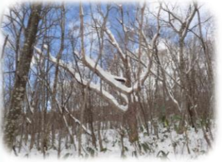
ダケ男爵 (ダケカンバ)