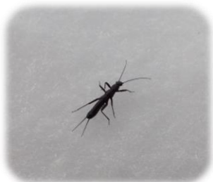
ユキクワ カワゲラ