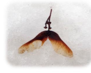
ハウチワカエデ の種子