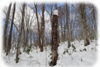
マダム・ シャンデリア (ブナの枯れ木と ツルアジサイ)